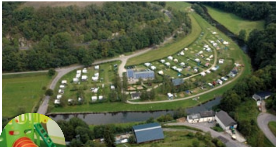
Luftansicht / Aerial View / Aerial View

Gelegen in een idyllische vallei van de rivier de Sûre, charmeert camping Toodlermillen iedereen die van de natuur houdt. Het schone, goed onderhouden en milieubewust gevoerde terrein is een ideale plaats voor degenen die de dagelijkse stress achter zich willen laten en rust zoeken. Het schone water van de Sûre, omzoomd door ruime ligweides, nodigt kinderen en volwassenen uit tot onbezorgd badplezier.